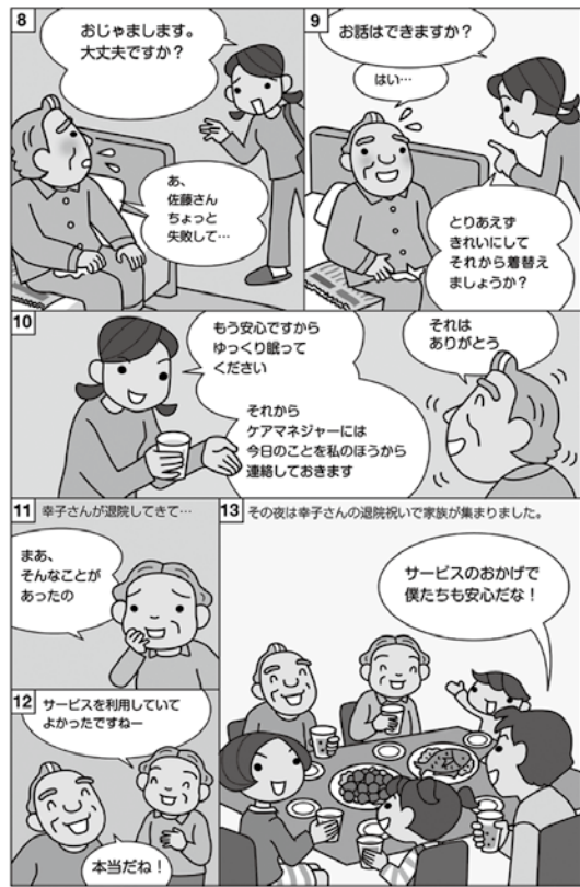
定期巡回・随時対応型訪問介護看護説明パンフ (一部)

事業について、支部や班に職員が説明に伺います。是非、声をかけて下さい。 さつき事業所・長川まで ☎070(5371)2952