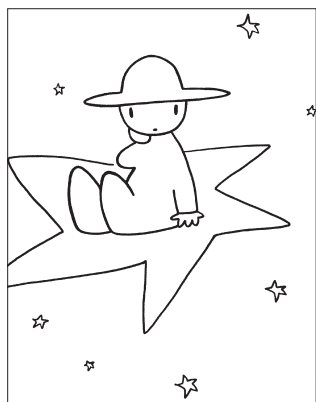
成田支部 南 みつぐ