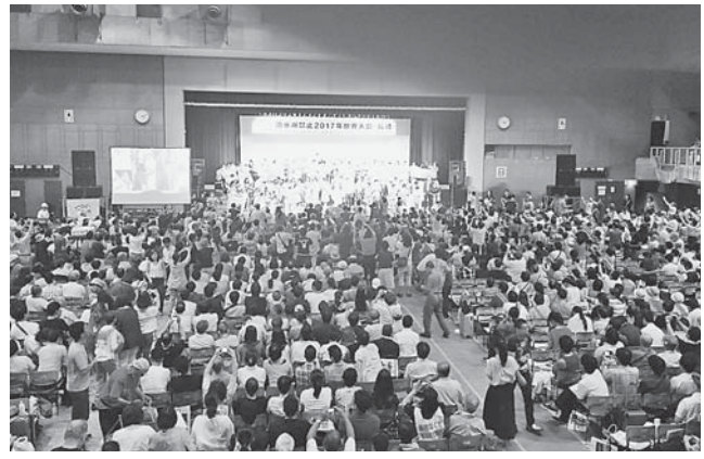
満席の長崎全体総会

8月7日(9日、原水禁世界大会が、長崎で開催され、組合員・職員の募金の力で、けいはん医療生協から3名が参加しました。国連での核兵器禁止条約採択を受けての大会であり、内外の大きな注目の場となりました。直接参加し、見て聞いて、肌で感じ、感動したとの感想が寄せられています。