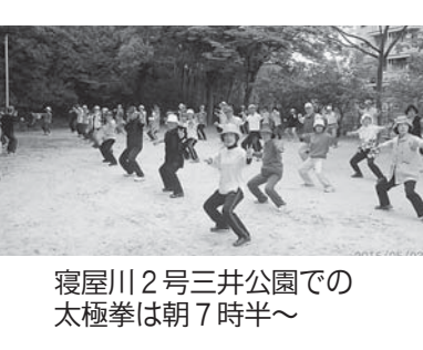
寝屋川2号三井公園での太極拳は朝7時半～

早朝活動で6時半から、毎回参加費10円の北打越公園の太極拳は年中無休。月2回、第2第4木曜には、虹のひろばで