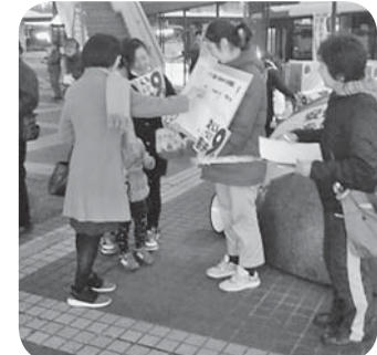
シール投票中・守口

職員と一緒にきてくれた子ども達も一生懸命に「シール投票」の呼びかけをしてくださいました。「安倍さんはおかしい。戦争は絶対反対です」との一言メッセージも寄せられています。