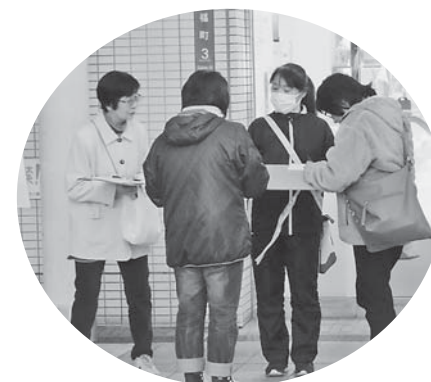
若者も気軽に署名・門真