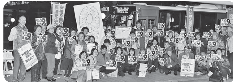
変えるな9条!のポテッカーを掲げて・寝屋川

3月23日(金)夕方、3市駅頭で同時に憲法9条守れの行動に取り組み、組合員と職員、総勢123名という規模となりました。マイクで道行く人達に、「憲法9条は日本の宝だけでなく世界の宝、「戦争をする国ではなく憲法9条をみんなで守っていきましょう」と訴え。