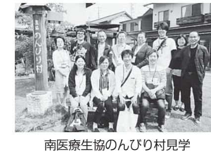
南医療生協のんびり村見学

けいはん医療生協を支える幹部の集学的育成を目的に、昨年6月から月に1回(1日)幹部育成研修を開催し、今年5月に8人が卒業しました。この幹部研修は、京阪電車の特急とかけて、特急のスピードで知識を蓄え成長してもらった。「けいはん特9」と名付けていました。研修内容は、協同組合の原理原則から情勢をはじめ、医療福祉政策の流れや経営分析、リーダーシップ論など、トップ幹部に必要な視点と知識を1年かけて幅広く学ぶことができました。参加者からは、「専務理事の右腕を担いたい」「けいはん医療生協を引っ張ってきたい」など、