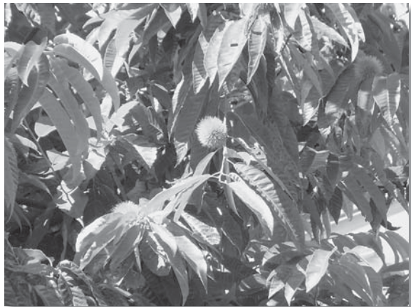
写真 秋を待つ栗たち 組織部 大松美樹雄