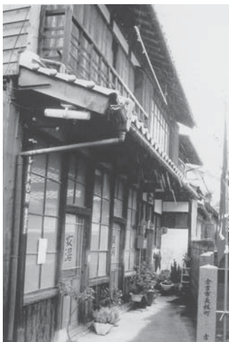
レトロな雰囲気の大社湯の入口

策していて銭湯「大社湯」に出会いました。明治40年（1907年）の創業、百余年の歴史を誇る現役の銭湯です。国登録有形文化財に指定されています。入浴料金大人350円。レトロな脱衣箱、番台も創業当時のまんまのこと。