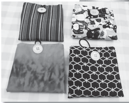
ともろぎ支部 手作り班