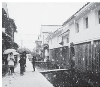
玉川沿いに立つ白壁土蔵群