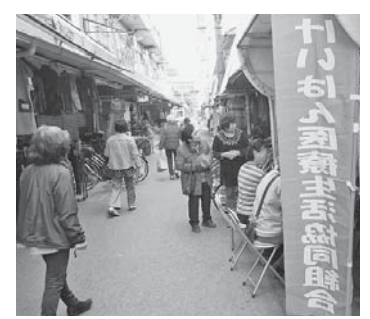
日新商店街での健康チェック

① 運動と事業の土台となる組織強化を ○支部・班の活性化は一人一役で、担い手の力を活かし、身近なネットワークづくりで組織強化をすすめます。 ○全国4課題をすすめる組織を強化し、地域での役割を發揮します。地域に根ざした1千人の仲間を増やしで1万3千人、9千世帯の新しい峰に挑戦します。出資 ② 行政区単位での連携と総合力で活気ある生協運動を ○出あい・ふれあい・支えあいの会「あいちゃん」の役割りを發揮させ、組合員要求を実現します。 ○「組合員交流センター・居場所・事業所」を活用し、地域の方に向けてもらい、新たなつながりづくりを促します。 ○多彩な健康づくり活動で地域の健康度向上に貢献します。 ③ 地域密着型サービスの優位性を発信し、介護事業所と医療との連携を強めサービスの質向上につなげていきます。 ④ 無料低額診療事業を拡げます。 ○理念・ビジョン・いのちの章典を實踐する人づくりを ○学習を通して、ともに学び・育ちあう人づくりをすすめます。 ○次世代を担う人材育成をすすめます。 ○組合員と協同で人材確保をすすめます。