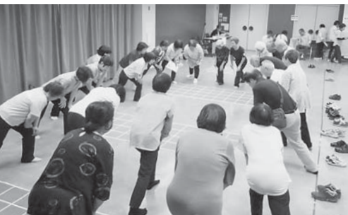
健診スタートアップ集会

① 「支部を単位に班を基礎に」した組織づくりで、組合員の「出資・利用・運営参加」を強めました ○行政区単位の医療生協の総合力を活かし「地域まるごとケア」の実現をすすめました。 ○強化月間の成功を通じ ② 組合員との協同、関係事業所・団体との「連携・共同」で地域のネットワークづくりをすすめました ○出あい・ふれあい・支えあいの会「あいちゃん」の活躍でその人らしさを支えました。 ○「組合員交流センター・居場所・事業所」を拠点にした活動で、地域要求実現に貢献しました。 ③ 運動と事業を守り発展させる視点で事業 ④ 地域・職員組合員