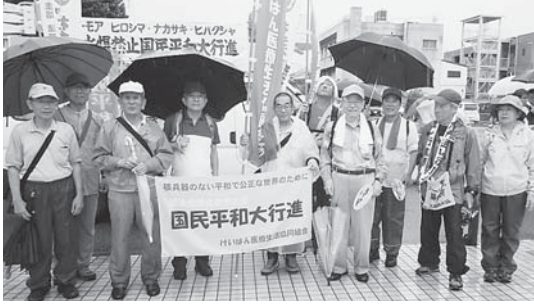
雨の中の平和行進