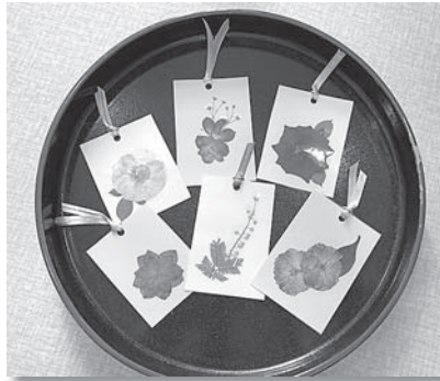
押し花アート みい西支部 磯野 善江