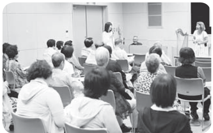
9/13守口協議会 月間スタート集会

一 支部体制を豊かに、行政区単位で組織強化を (一) 「支部」体制強化、「班」活性化は、1支部15人の運営委員体制と、チャイムで始まるひと声運動でつながりを強めます。 (二) 「地域まるごとケア」を育む全国四課題は、1000人の仲間増やしと500,000千円を確保します。 二 関係団体・行政との共同でまちづくりをすすめます (一) 出合い・ふれあいの活動を通じて、組合員・地域要求にこたえ、その人らしい暮らしを支えます。 (二) 「健康づくり」は生きがいづくり「活動で楽しい健康づくり」に貢献し守り、誰ひとり取り残されず、