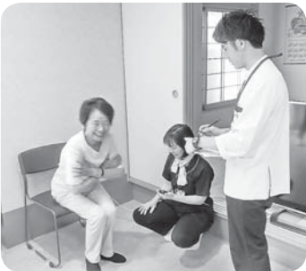
5/29守口協議会 月間スタート集会

(三) 「おおさかまるごと健康チャレンジ」の広がりと、健康づくりサイクルの実践で組合員の健康づくりに貢献しました。 (四) 「安倍9条改憲NO」憲法を活かす全国統一署名「の積極的などりくみを通して、憲法を暮らしに活かす、社会保障を守り、誰ひとり取り残されず、