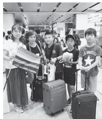
8/7 原水禁世界大会参加

さなわ社会の実現をめざしました。 三 暮らしを支えるための持続可能な事業の強化・充実にとりくみました (一) 行政区(協議会・事業部)内の運動と事業を両輪に医療生協らしき、三位一体の参加で「利用結集」にこだわりました。 (二) 事業部を単位に「地域まるごとケア」のカタチづくりでサービスの質向上をめざしました。 四 「いのちの章典」を実践する人づくりをす