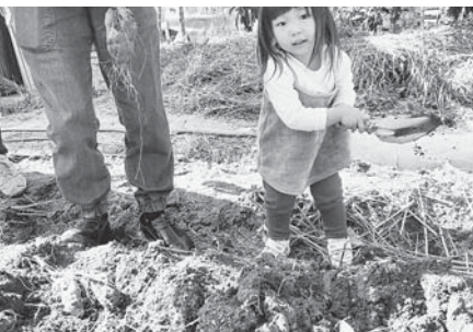
11/9 ともろぎ支部 健康まつり&収穫祭

四 「いのちの章典」学習・実践で医療生協の理念を深めます (一) 職員、組合員別の年間学習計画をもとに理念学習を基本につながり深まる学習・実践をすすめます。 (二) 次世代を担う人材育成をすすめます。 (三) 組合員と職員協同のとりにくみで、人材確保と職場づくりをすすめます。