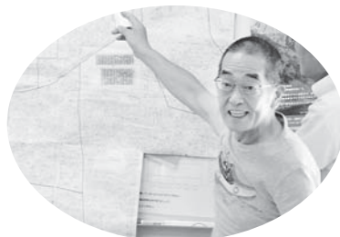
9/7 真貝協議会 月間スタート集会

人工呼吸器というのは高酸素濃度の空気を肺に送り込む機械です。重度な呼吸不全に陥った時、口から鼻から管を気管支に挿入し、その管を人工呼吸器につなぎ、機械から高濃度の酸素(100%の酸素まで可能)を含む空気を肺に強制的に送り込み、肺炎が治まるまで低酸素血症をしのぎます。コロナウイルス性肺炎の多くは重度の呼吸不全になるため、人工呼吸器が必要とする患者が多くなります。機械が足りな