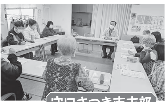
守口さつき南支部