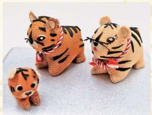
トラの親子 みいパッチワークサークル 木沢佐千子