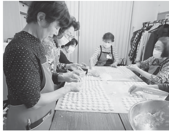
3千個つくるのは大変!!

ポロンテ イ・みど りグループ では、毎年、 ポロンティア の財政活 動として、 ホウ酸(ご きぶり)団 子を年間3 千個程度作 っています。 材料は