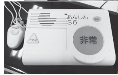
利用者がスタッフにすぐにつながらる簡易型緊急通報装置シルバーホンオールキャスト

「いつでもさつき」は、安心してご自宅での生活を続けるためにお手伝いさせていただきます。文字通り、「いつでも」も「ご相談ください」。 事例① 「インスリン注射を打つのが、1人では不安。見守りして欲しい」ということで、看護師と介護福祉士が連携して、1日3回のインスリンの自己