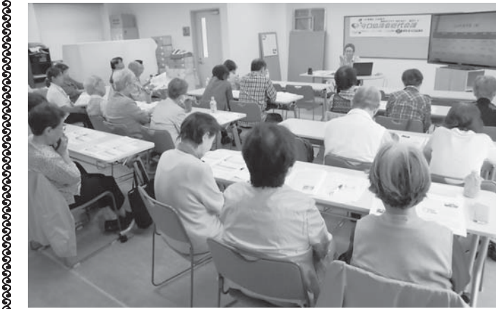
熱心にきく参加者

地域の困りごと、組合員の声と願いを、支部・班で真っ先に議論を! 業、「なんでも相談」のよびかけの後、質疑にうつりました。 業代の無料低額診療事業実現の道。支部・班段階での「あいちやん」の取り組みの取り組みと支援会員をどうにかやすすのか。支部運営委員会で地域の 状況をまず知る事の大切さ。日曜健診でのボランティアと個人情報保護法との関係等々の質問・意見がだされ、専務が回答しました。