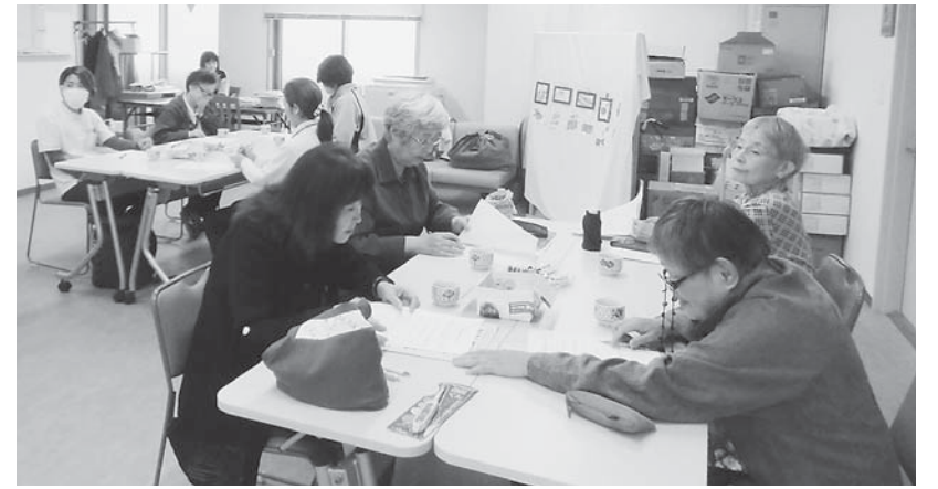
守口会場での膝詰の交流