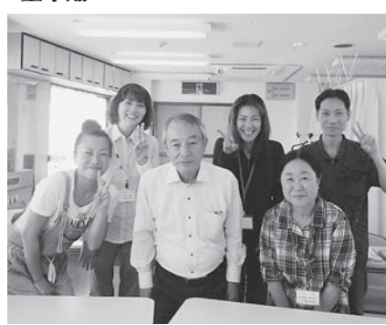
修了おめでとうございます