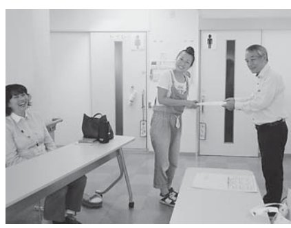
戸田理事長から「よくがんばりました」