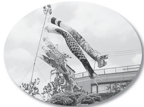
写真 鯉のぼり 組織部 大松美樹雄