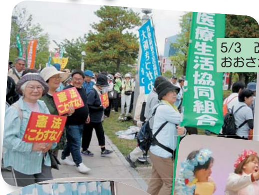
5/3 改憲NO! おおさか総がかり集会