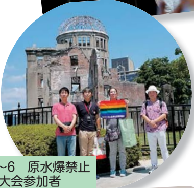
8/4~6 原水爆禁止世界大会参加者