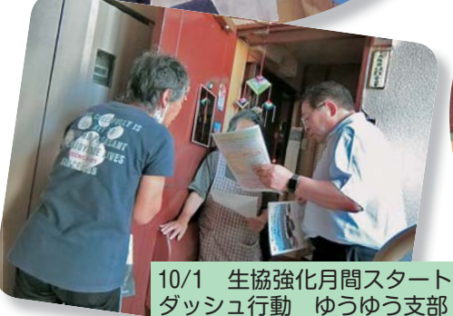
10/1 生協強化月間スタート ダッシュ行動 ゆうゆう支部