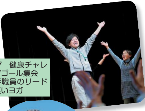
2/27 健康チャレンジゴール集会 若手職員のリードで笑いヨガ