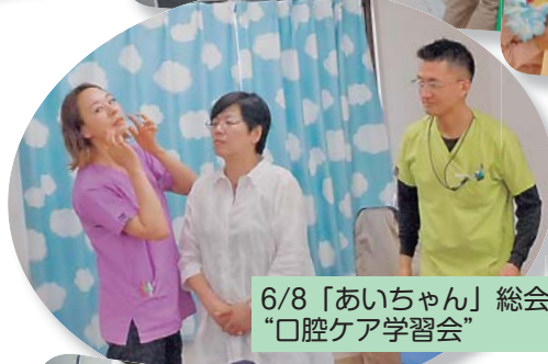
6/8 「あいちゃん」総会で「口腔ケア学習会」