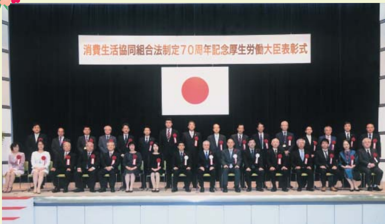
消費生活協同組合法制定70周年記念厚生労働大臣表彰式