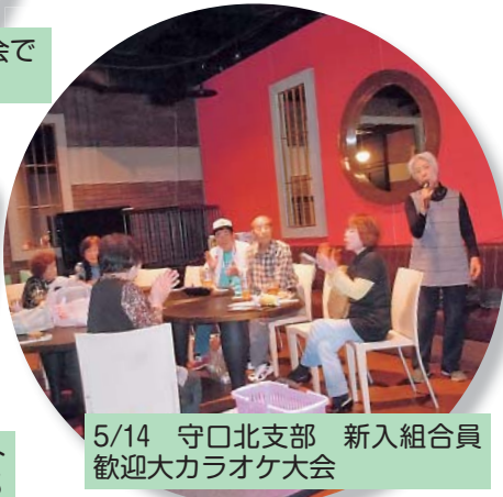
5/14 守口北支部 新入組合員 歓迎大カラオケ大会