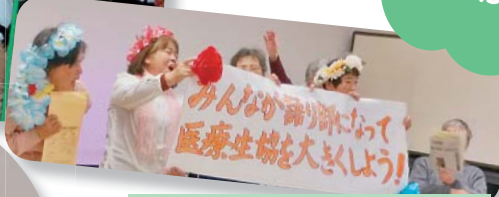
1/27 寝屋川しゃべり場 みい西支部 「訪問行動…妖精たちとともに」