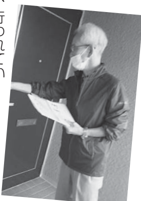
訪問行動でピンポン (みい西支部)

新聞を毎日声にだして読んでいます(音読)。なんとなく気分も晴れ、コロナ禍でも前向きになれました。大変な時期、音読で脳を活性化しましょう。