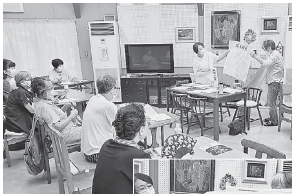
組合員訪問のために、つながりマップをどう使うか相談中